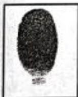
Yrma Castilla de Pachas