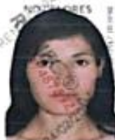
Foto del Ciudadano